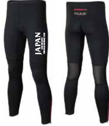
H ロングタイツ ¥11,000