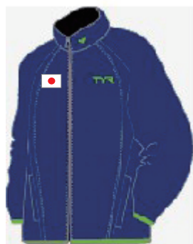
E ウォームアップジャケット